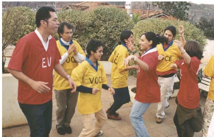
eu-você , serigrafia, camisas, jogos, exercícios. Realizado em Diamantina, Brasil, 2000.

imagens e vídeos produzidos durante as ações. Essas imagens são concebidas e administradas sem o compromisso de representar a realidade da ação e, portanto, abrem espaço para a ficção e a narrativa através da edição em vídeo e reenquadramento fotográfico – ou seja, a intenção é afastar-se da ‘pura’ documentação e estar livre para jogar com as imagens de acordo com propósitos expositivos, que incluam os principais conceitos do projeto. Portanto, cada proposição de jogos e exercícios eu-você acaba resultando em duas experiências: uma para os participantes e outra para a audiência. Ambas pretendem ser intensivas. A fotografia abaixo, mostrando um momento desse projeto, nos leva à primeira parada: