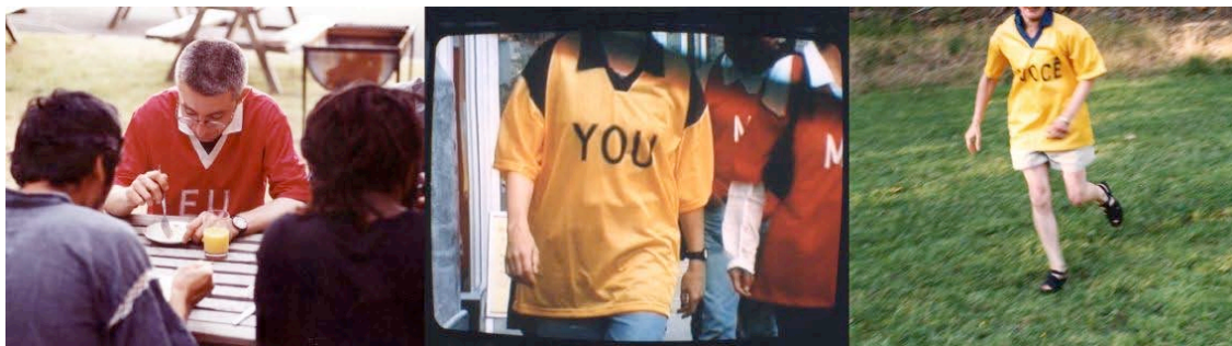
eu-você , serigrafia, camisas, jogos, exercícios. realizado no País de Gales, Grã-Bretanha, Brasil, 1999.

Assim, os jogos & exercícios eu-você são planejados para proporcionar, tanto a mim quanto aos participantes, uma investigação intensiva sobre os 'pronomes em deslocamento'. Em termos de dinâmica de grupo – o padrão comum nós e eles é retrabalhado e expandido através desse processo.