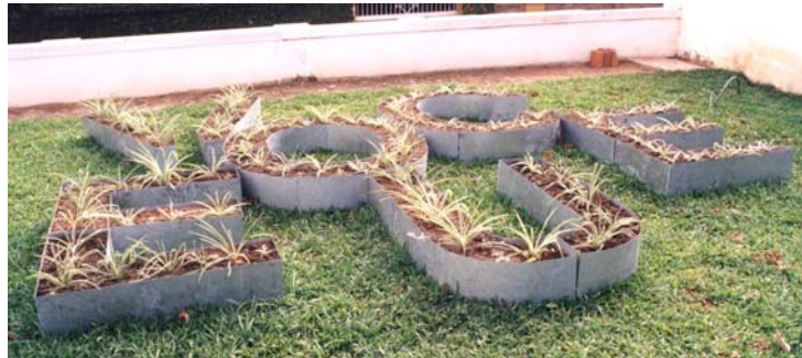
superpronome , metal, terra, plantas, 2000.

gama de outras possibilidades (agrupamentos, desagrupamentos). Espero que esse processo encontre seu próprio modo de realizar-se, inteira ou parcialmente, significando que o superpronome irá progressivamente negociar o seu modo de ação no campo das manobras coletivas.